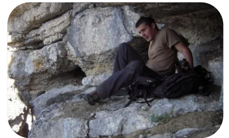
Après les déménageurs et les bûcherons, voici l'alpiniste de l'extrême !

Chaque mois, retrouvez quelques photos du trombinoscope, topic très actif de La Place de la comédie . ●