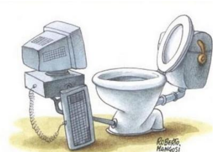
Pour continuer de poster, où que vous soyez !

Sur ce je vous souhaite un bon dimanche... Ou mardi, ça dépend du jour en fait, et vous dis à bientôt !