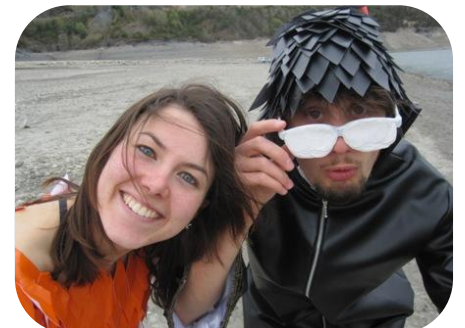
Une correctrice et un admin un poil atypiques, mais c'est bien pour ça qu'on les adooooore ! <3 (Les4 : Kana, le orange te va trop bien *-*)

Maintenant, à vous de jouer : devinez qui sont les trois inconnus sur la photo !