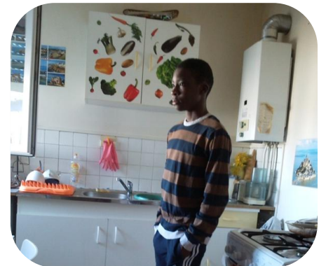
Grâce à son pense bête, Xvii mange bien 5 fruits et légumes par jour.